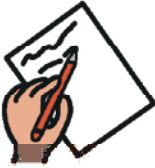
Zettel vom Amt ausfüllen.

Wenn Sie den Antrag gestellt haben, bekommen Sie einige Zettel. Auf denzetteln wird gefragt, welche Hilfe und wie viel Hilfe Sie brauchen.