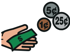
Sie brauchen viel Hilfe = Sie bekommen viel Geld.

Wie viel Geld Sie bekommen, hängt davon ab