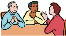
Gespräch beim Amt.

Das können Sie mit einem Mitarbeiter aus dem Amt besprechen. Der Mitarbeiter kann Ihnen auch helfen, die Zettel auszufüllen. Sie können die Zettel auch selbst ausfüllen und zurückschicken.